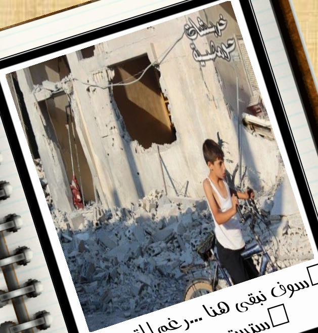
سوف نبقى هنا... رغم القصف ستستمر الحياة