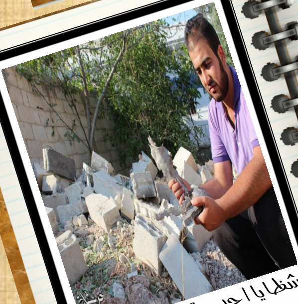
أنتظايأ إحدى قذائف المروحية في القصير