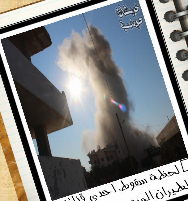
لحظة سقوط إحدى قذائف الطيران المروحي في القصير