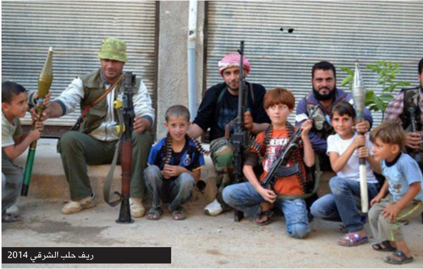
ريف حلب الشرقي 2014

للمنظمة أن الجيش الحر مستمر في قبول الأطفال في صفوفه.