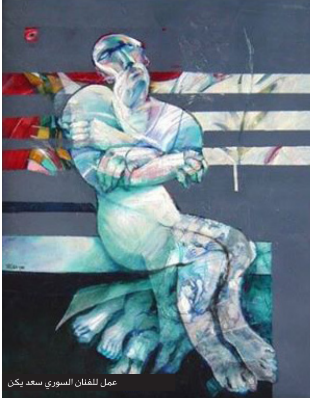
عمل للفنان السوري سعد يكن

لعل ما ذكره إدريس يمثل جانباً بسيطاً من التشوه الداخلي الذي يلحق بالمعتقل، فكيف هي الحال والمعتقل مشوهٌ نفسياً وجسدياً وكيف الحال إذا كان المعتقل طفلاً أو امرأة، لذا فنحن بأشد الحاجة لتطبيق فكرة العدالة الانتقالية في سوريا المستقبل والتي أساسها محاسبة الجناة وتعويض ما أمكن على المتضررين من خلال خطة عمل تتلخص بمحاسبة الجناة بشروط قانونية ودستورية والإفراج عن كافة المعتقلين السياسيين وإعادة الحقوق المدنية للمحرومين منها.