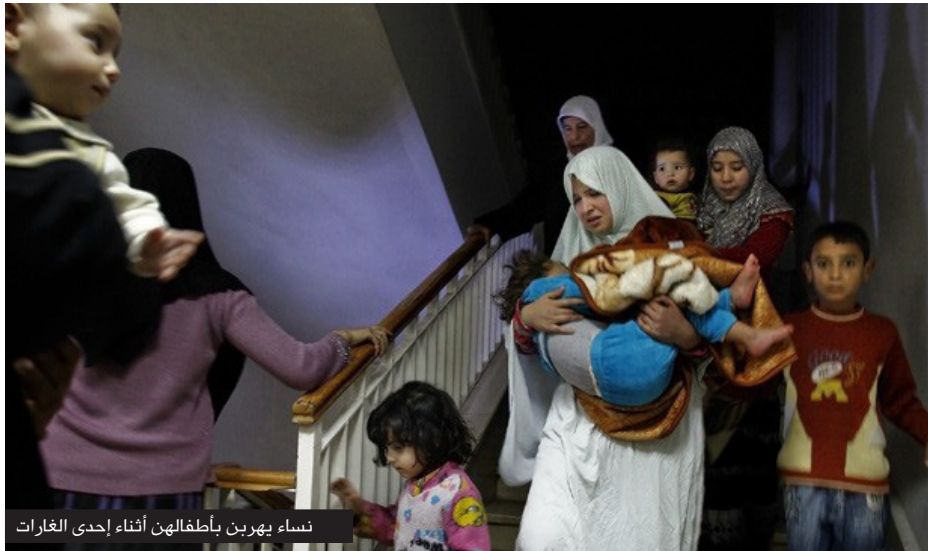
نساء يهربن بأطفالهن أثناء إحدى الغارات

يذكر أن البروتوكول الاختياري لاتفاقية حقوق الطفل " وصدقت عليه سوريا في 2003 " يحظر على القوات الحكومية والجماعات المسلحة غير التابعة لدول استخدام الأطفال وتجنيدهم، وتعريف الطفل هو أي شخص تحت سن 18 عاماً، كمقاتلين أو في أدوار داعمة. يعد تجنيد الأطفال تحت سن 15 عاماً (بما في ذلك في أدوار داعمة) جريمة حرب بحسب تعريف نظام روما المنشئ للمحكمة الجنائية الدولية.