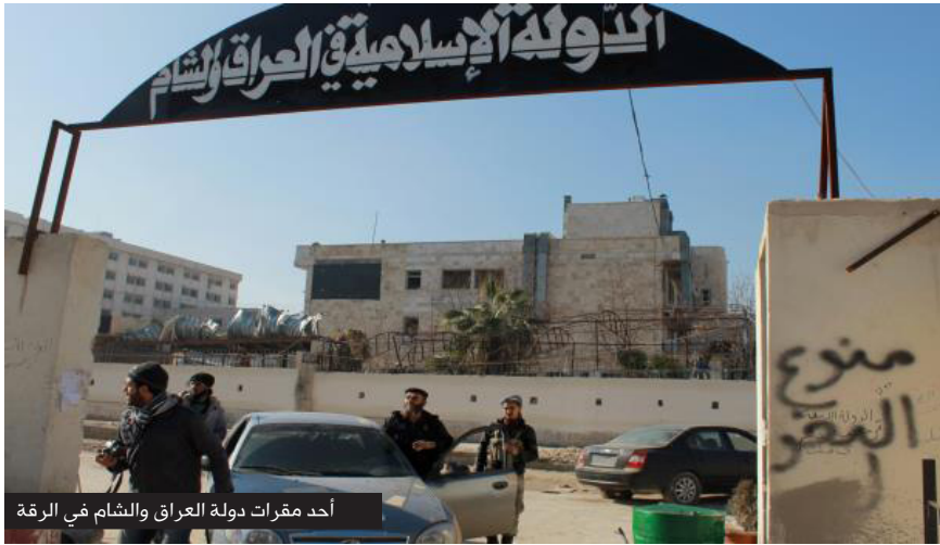
أحد مقرات دولة العراق والشام في الرقة

طالبت هيومن رايتس ووتش جماعة الدولة الإسلامية في العراق والشام (داعش) بالإفراج الفوري عن حوالي 133 صبياً كردياً تتراوح أعمارهم بين 13، 14 عاماً أخذتهم كرهائن من بلدة عين العرب (أو كوباني بالكردية) ذات الأغلبية الكردية في 29 أيار الماضي بينما كانوا عاندين من تأدية امتحانات آخر العام بمدينة حلب، لمبادلتهم بأسرها الموجودين لدى الجناح المسلح لحزب الاتحاد الديمقراطي.