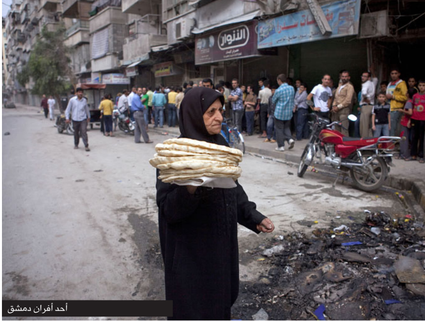
أحد أفران دمشق

"نأكل خبز حاف ولا نذل"، مثل قديم يضرب في دمشق، لكن اليوم حتى الخبز الحاف يبدو أنه لن يكون بمتناول الجميع، حيث تنتشر بين الدمشقيين إشاعة قوية حول رفع سعر كيلو الخبز، الذي يعتبر المادة الغذائية الأساسية لغالبية السوريين، لدرجة أنهم يقولون أنهم لا يشعرون أنهم تناولوا طعامهم إن لم يتناولوا الخبز.