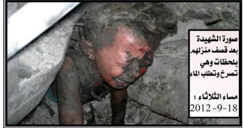
صورة الشهيذة بعد قصف منزلهم بلحظات وهي تصرخ وتطلب الماء : مساء الثلاثاء : 2012-9-18