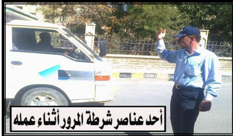
أحد عناصر شرطة المرور أثناء عمله

• عودة شرطة المرور الثورية لأداء مهامها في تنظيم عملية المرور و السير داخل المدينة بشكل أكثر تنسيقاً و تنظيمياً .