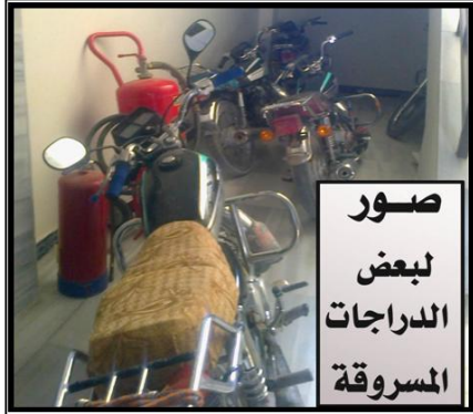
صور لبعض الدراجات المسروقة

• احتراق ثلاث شاحنات محمّلة بالسكر على طريق مسكنة - الخفصة نتيجة قصفها بالطيران الحربي .