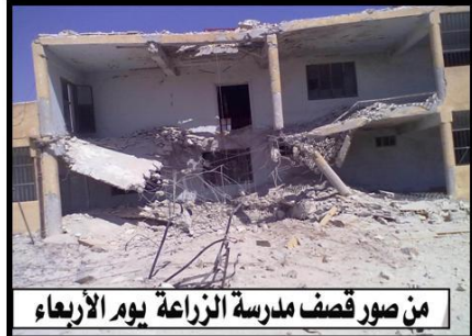
من صور قصف مدرسة الزراعة يوم الأربعاء

• إقبال خفيف و متقطع لطلاب على بعض المدارس الإعدادية في بداية الأسبوع إلا أن الطلعات الجوية المتكررة و القصف في وضوح النهار ( أثناء وجود الطلاب في المدارس ) قضى على أحلام أطفالنا في عودتهم لمدارسهم .