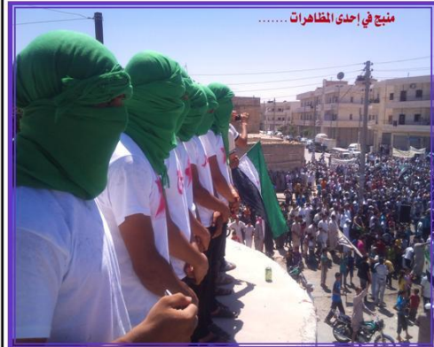
منبج في إحدى المظاهرات .....