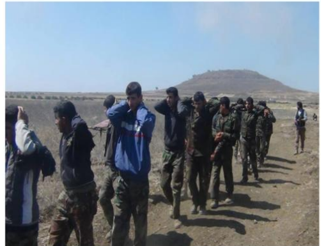
صورة لأسرى النظام من تل الجموع

نصر كبير حققه ثوار حوران باقتحامهم وبسط سيطرتهم على تل الجموع الاستراتيجي في محيط مدينة نوى وأسرههم لقرابة ٨٠ عنصر من قوات النظام المعركة التي انتهت لصالح الثوار