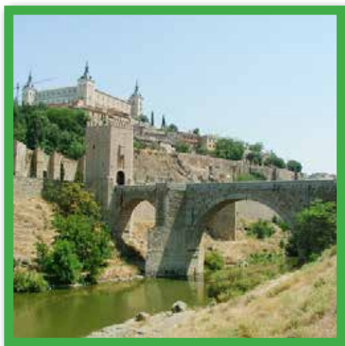
مدينة طليطلة - اسبانيا