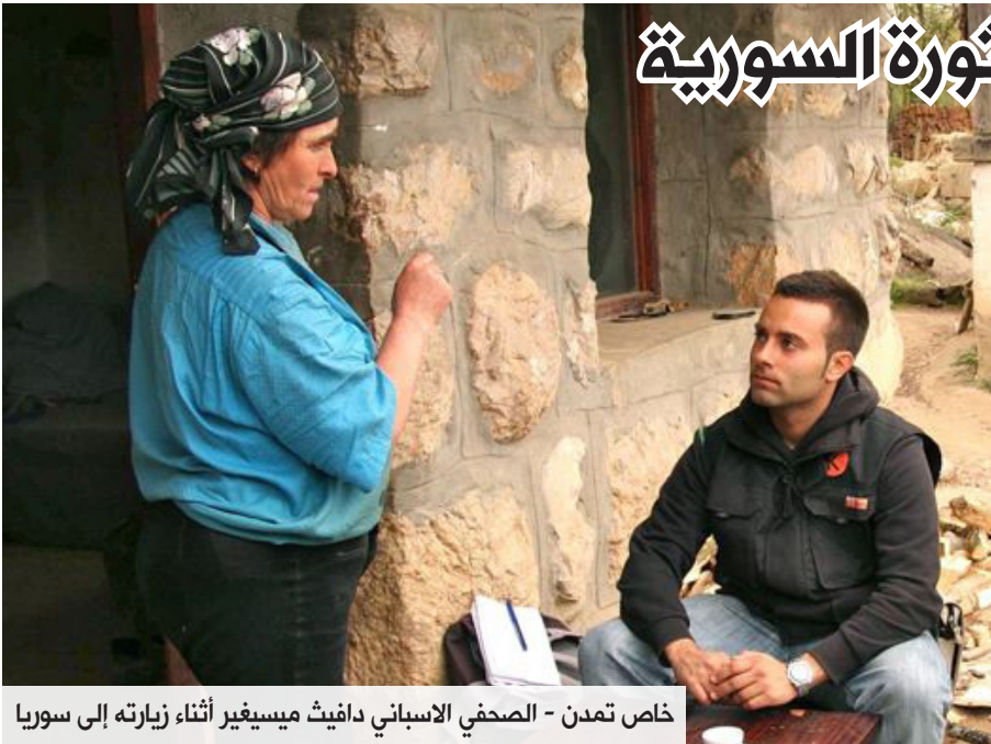
خاص تمدن - الصحافي الاسباني دافيث ميسيغير أثناء زيارته إلى سوريا

من وجهة نظر السيد ميسيغير بأن الكثير من المعلومات عن سوريا مضلل أو دعائي، والطريقة الوحيدة لتجاوز هذه المشكلة هي التواجد على الأرض، والتواصل مع الصحافيين الذين يتواجدون داخل سوريا، أما بصدد سؤال "تمدن" حول تعامل الوسائل الإعلامية الإسبانية مع الأزمة السورية فقد أجاب السيد ميسيغير: "البعض التزم بالمواقف السياسية، والبعض الآخر اعتمد على المراسلين غير الحصريين أو واكالات الأنباء في نشر معلومات عامة عن الوضع في سوريا"، أما بالنسبة للمسألة الكردية يرى ميسيغير بأن هذه القضية بدأت تأخذ حيزاً أوسع في الإعلام، بسبب معاركهم ضد الجهاديين في المناطق الكردية، إعلانهم للإدارة الذاتية، ويقول حول ذلك: "الكرد أدركوا بشكل جيد أهمية الإعلام العالمي لتغطية قضيتهم، المعارضة تعاملت بشكل