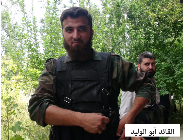
القائد أبو الوليد

وأوضح أنه ومن خلال عمليات الرصد والاستطلاع المستمرة لعصابات الأسد الطائفية، تبين أن قوات النظام قامت بإخلاء اللواء ٢٢، ومطار الضمير من جميع عناصرهما العسكرية وتم توزيعهم على مناطق مجاورة بعد التهديدات الأميركية للأسد بضربة عسكرية، تطال المطارات وبعضاً من ثكناته العسكرية.