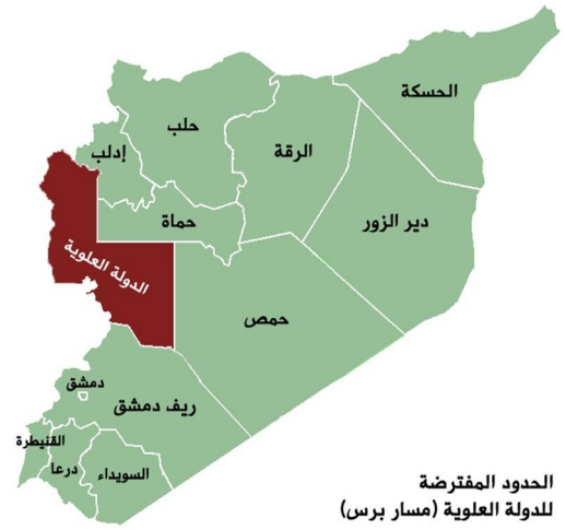
الحدود المفترضة للدولة العلوية

- هذا الكيان سيعطي مبرراً للصهاينة لإعلان إسرائيل دولة يهودية، فهي تشجع خطوة الأسد حتى لا تكون دولتها بدعة بين الدول.