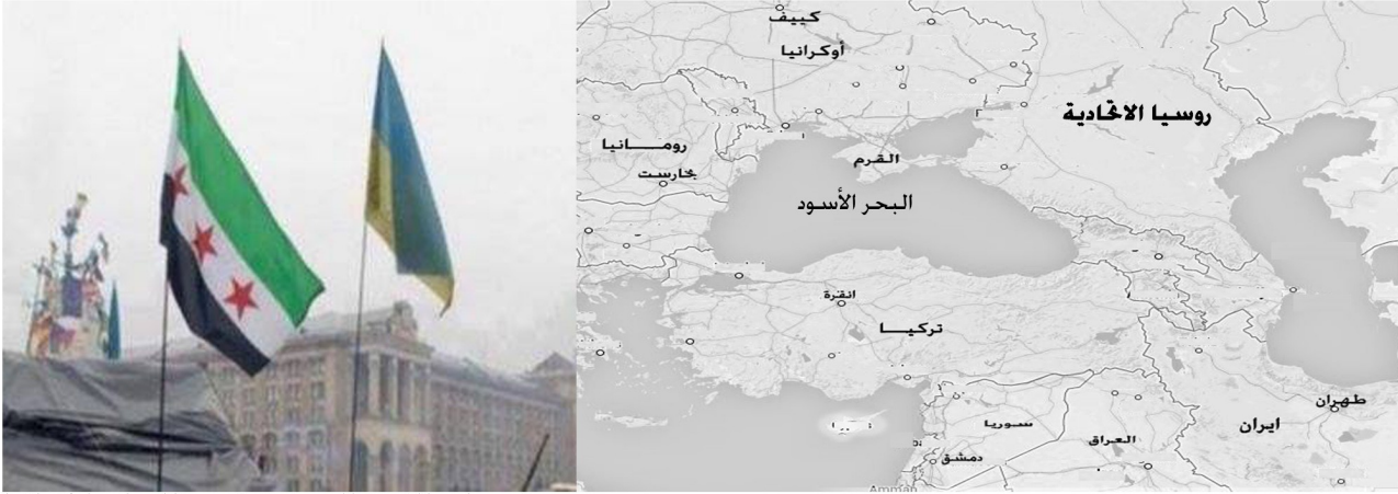
رفع علم الثورة السورية في مظاهرات اوكرانيا

بشكل درامي على الطريقة التونسية حيث غادر الرئيس الموالي لروسيا قصره فجأة باتجاه الحدود ما شكل هزيمة لا يمكن لموسكو القبول بها إطلاقاً كون أوكرانيا العضو السابق في الاتحاد السوفيتي تحوي قواعد وأساطيل روسية ضخمة وهي المعبر الرئيسي لصادرتها من الغاز والنفط لأوروبا.