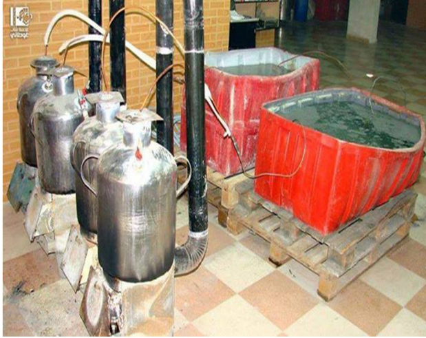
تصنيع محلي لسائل السيروم في الغوطة

الحصار حيث أنشأ أطباء معنيون وناشطون في المجال الطبي هناك ورشة لتصنيع وتركيب الأطراف الصناعية التي تصنع أساساً من ألياف الكربون والبلاستيك ولكن في ظل ظروف الحصار باتت تصنع من المواد النالفة في الحاويات أو من بقايا خزانات المياه البلاستيكية المثقوبة جراء القصف . كما تتم صناعة المفصلات المتحركة من حديد السيارات المدمرة ومخلفات القذائف ! وأمام العجز الكبير في واقع المشافي الميدانية في معظم الاحتياجات فقد تم إنتاج الماء الملحي المقطر " السيروم " ولكن بكميات قليلة نظراً لضعف الإمكانيات . حيث ينتج أحد المصانع في جنوب دمشق ١٠٠ لتر أسبوعياً بينما الحاجة اليومية هي ١٥٠ لتر!