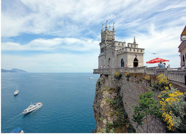
قلعة عيش السنونو في جمهورية القرم

ونفي الشعب التتري المسلم يومها في عربات القطارات المخصصة نقل الحيوانات والبضائع التي لم تكن تتوقف إلا لأجل الاستزادة بالوقود وإلقاء جثث الموتى حيث مات الشيوخ والأطفال من شدة تكديس العربات التي ظلت تسير ليلا ونهارا مدة شهر كامل وفي الخمسينيات قام زعيم الاتحاد السوفيتي خروتشوف بضم القرم لمسقط رأسه أوكرانيا التي كانت جزءا من الاتحاد السوفيتي وكانت يومها عملية شكلية إلا أن انهيار الاتحاد السوفيتي وبقيائها مع أوكرانيا أوج الصراع حول الجزيرة الاستراتيجية التي بدأ يعود لها أبنائها التتار فباتوا يشكلون حاليا أكثر من ٢٠٪ من السكان وهم يعارضون الانضمام لروسيا وربما قد يقودون عمليات لمقاومة الغزو الحالي .