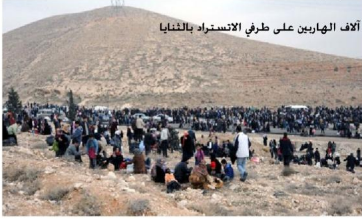
آلاف الهاربين على طرفي الاسترداد بالثنايا

الخروج تم بإجّاه القطيفة والضمير وقد وصل عدد من العائلات لمدينة الرحيبة يذكر أن هناك عشرات الآلاف لازالوا محاصرين بالمدينة العمالية مع خشيتهم من الإعتقال حيث قامت قوات النظام بتحويل مدرسة السواقة وقسم من معمل الإسمنت لمركز احتجاز لأفراد وعائلات من النازحين .