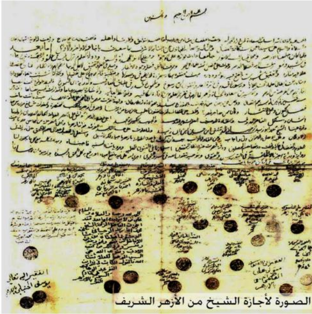
الصورة لإجازة الشيخ من الأزهر الشريف

وفي عام ١٨٦٨م عاد إلى الرحيبة. حيث بنى جامع الجب المعروف حالياً باسم (جامع زيد بن حارثة). توفي عام ١٩٣٤م.