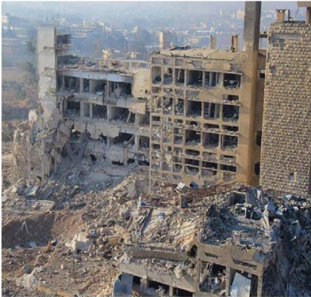
مشفى الكندي من أهم مشافي السرطان في سوريا لم يغادره النظام قبل دماره

والفرقة الرابعة خلال عام كامل من المحاولات الفاشلة . - البنود تنص على إدخال المواد الغذائية بعد رفع علم ذو النجمتين الخضر فوق خزان البلدة لثلاثة أيام في حال استمرار التهدئة لأسبوع تبدأ مفاوضات هدنة . تشير هذه الهدنة في حال نجاحها إلى اعتراف النظام بأقوى تشكيلاته بطرف مسلح على بعد مئات الأمتار من أهم المواقع العسكرية و السيادة له .