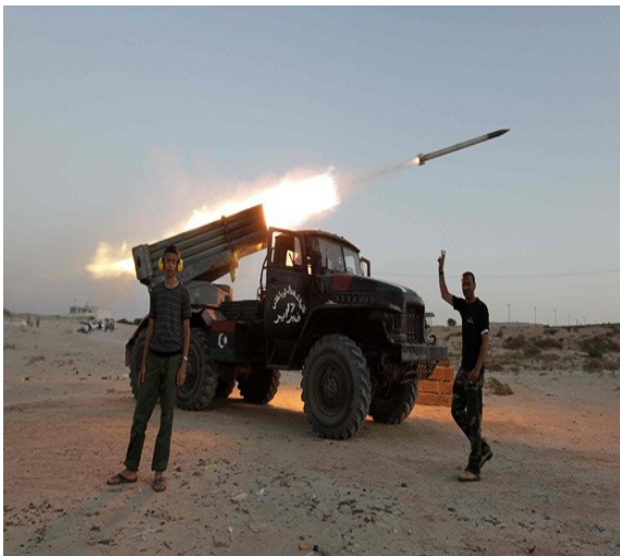
الإطلاق من منصات

من أكثر الصواريخ المستخدمة عسكرياً في الحروب والنزاعات الإقليمية، نظراً لمداه القصير ولفعاليته التدميرية