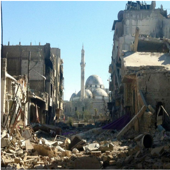
حمص - جامع خالد بن الوليد

هذه الابيات للشاعر ابو البقاء الرندي قالها في رثاء الاندلس ومدينة حمص الاندلسية قبل 500 عام . نتذكرها كانها اليوم انما عن حمص الاصلية :