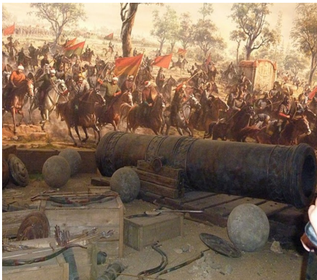
متحف تركي يعرض للحاضر أثر من مجد غابر

تم تصميمه على يد المهندس المجري أوربان الذي عرض تنفيذه لصالح إمبراطور القسطنطينية الذي رفض الفكرة فتوجه الى زعماء أوروبا المسيحية آنذاك طالباً التمويل والدعم فقابلوه بالسخرية والازدراء. فلم يبق أمامه سوى الذهاب إلى السلطان العثماني الشاب محمد الفاتح الذي استقبله وقدر فيه أفكاره الطموحة ووظف له الإمكانيات الهائلة. وبعد مضي ثلاثة أشهر كان أوربان قد انتهى من صنع ثلاثة مدافع ضخمة. كان لها تأثير كبير في فتح القسطنطينية ٤٥٣ م التي أصبحت عاصمة الخلافة الإسلامية فيما بعد إسطنبول حالياً. يظهر من هذه القصة جلياً كيف يتم توظيف خبرات الغير لمصلحة الأمة. والتعامل الحكيم مع قضية الولاء والكفاءة.