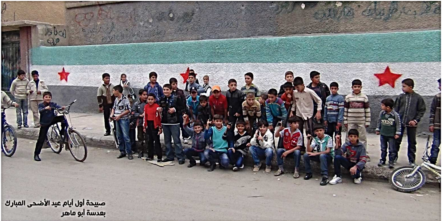
صبيحة أول أيام عيد الأضحى المبارك