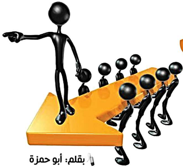
بقلم: أبو حمزة