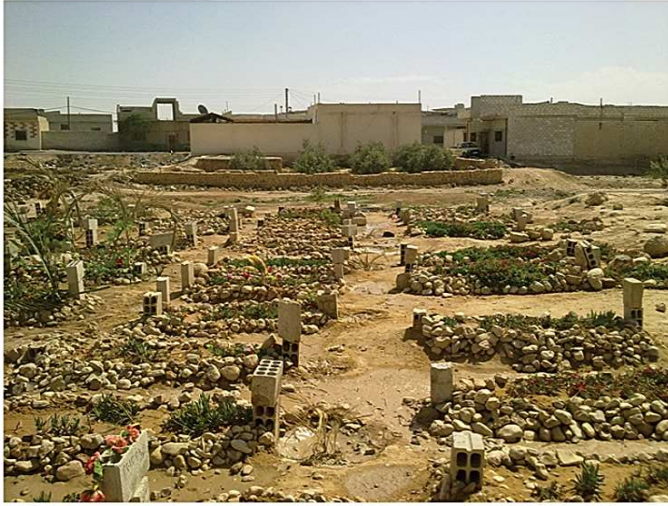
مقبرة الشهداء في مدينة ضمير