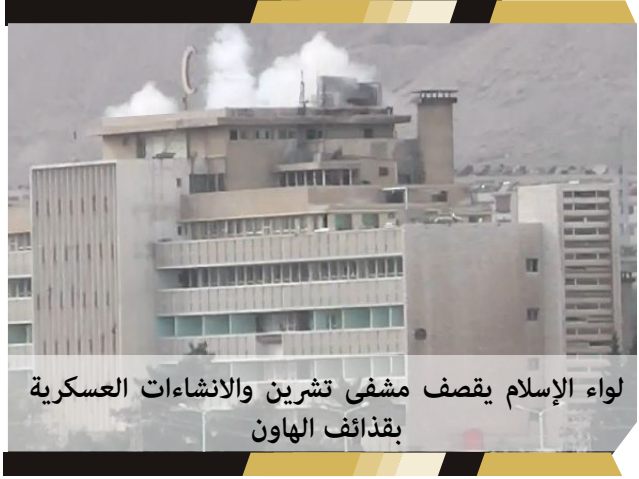
لواء الإسلام يقصف مشفى تشرين والانشاءات العسكرية بقذائف الهاون