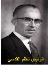
الرئيس ناظم القدسي

طلب الرئيس السوري ناظم القدسي من عاملة الهاتف وكان في بيته في حلب أن تعطيه رقم بيت وزير الخارجية عبد السلام العجيلي في الرقة لأنه بحاجة للتحدث معه في أمر يهم الدولة، فقالت له لحظة سيادة الرئيس، وبعد دقيقة قالت له : بعذر سيادة الرئيس الرقم خاص، وأنا لا يحق لي أن أعطي أي رقم خاص لمواطن سوري لأي شخص حتى ولو كان رئيس الجمهورية، فقال لها الرئيس : بارك الله بك وكثر من أمثالك.