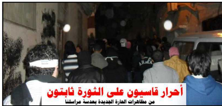
أحرار قاسيون على الثورة ثابتون

وكان يوم الذكرى السنوية حافلاً للغاية بمظاهرات الحرية وخاصة في منطقة الصالحية حيث خرجت الأولى بالقرب من سوق الصالحية الشهير ضمن شارع الحمراء وقد هاجمهم الشبيحة والعصابات الأسدية والأنباء تشير إلى اعتقال عدد من الشباب وضربهم بشكل وحشي، في حين خرجت الأخرى بمنطقة ليست بعيدة قرب حديقة السبكي في حي أبو رمانة وذلك رداً على مجازر النظام ونصرة للمدن المنكوبة، وتم قطع الطريق أيضاً وكانت حالة عصابات اللا أمن هستيرية للغاية. وختم أحرار قاسيون مظاهرات الخميس بمسائية رائعة في حارة أبو