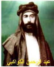
عبد الرحمن الكواكبي

حدثني سلام الكواكبي حفيد أحد أهم رجال سوريا عبد الرحمن الكواكبي أنه كان مع أبناء عمه، في سيارة عمه ابن عبد الرحمن الكواكبي وكان وزيراً، فأوقفهم شرطي مرور وقال للوزير : شو اليوم يا سيادة الوزير؟ فقال الوزير : فهمت . وطلب من أولاده وابن أخيه سلام النزول من السيارة ومتابعة الرحلة مشياً على الأقدام، وعندما تساءل الاطفال المندهشون عن السبب، قال الوزير : لانو اليوم جمعة، وهو يوم عطلة ولا يجوز استخدام سيارة الدولة في أيام العطل أو للغايات الشخصية .