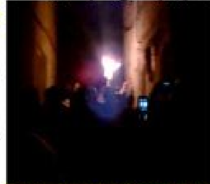
جانب من مظاهرات الأحرار في قاسيون - ركن الدين

وفي ركن الدين قام رجال عصابة الأسد بإغلاق جميع الطرقات المؤدية إلى جامع سعيد باشا، وانتشر قطعان اللامن بكثافة في المنطقة، وبعد انتهاء الصلاة شوهد عدد من سيارات الدفع الرباعي تسير باتجاه طلعة وانلي أول وباتجاه أحياء الصالحية، لتحصن جامع التقوى وجامع الداغستاني، كما شوهدت سيارة تحمل لوحة دير الزور ٨٥٨١٤١ ممتلئة بالعناصر المدججين بالأسلحة في حي الشيخ محي الدين.