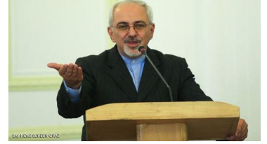
مركز دمشق الافتراضي للمعلومات الاستراتيجية والرأي althawara editorial th-editorial.blogspot.com

لكن كل ذلك من شأنه ان يخلق جو يتحتم فيه سباق نووي في الشرق الاوسط و المرشحين لهذا السباق مصر و الخليج العربي بالنسبه للسعوديه الامير سلمان وزير الدفاع في وقت سابق من ٢٠١٣ قام بزياره الى العاصمه الباكستانيه على رأس وفد معني لتسليم باكستان مهمه عبر اتفاق بين البلدين مفادها رفد المملكه العربيه السعوديه بتقنيه نوويه و تصنيع بنيه تحتيه نوويه مزدوجه الاستخدام ستكون في العربيه السعوديه تدريجياً لتأخذ المسار الاستراتيجي لمواجهه التهديد النووي الايراني المستقبلي خصوصاً في ظل تغت ايران و سعيها للهيمنه على المنطقه و الذي يأخذ شكلاً مقيت عبر التحريض الطائفي و استغلال الشيعه الذين تستخدمهم ايران كوقود لسياساتها في المنطقه العربيه