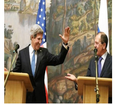
مركز دمشق الافتراضي للمعلومات الاستراتيجية والرأي althawara editorial th-editorial.blogspot.com

انتفاء الضروره السياسيه على اساس المنطق الدولي الذي يستند في جزئيه منه على الاخلاق الانسانيه بعد افتضاح امر الاسد بكونه البادئ بالاباده الجماعيه بالتالي ليس من المقبول بقاءه في السلطه دون ان تخسر موسكو ما ع وجهها في الشرق الاوسط خليجياً على الاقل .