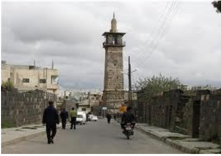
رغد ابو حوران درعا

في ظل انقطاع مقومات الحياة اليومية من كهرباء وماء والخبز وغيرها، استطاع الجيش الحر وجميع الكتاب المشاركة بتحريرو هذا الحجاز ومحيطه وتمشيته بشكل كامل، وثاني يوم قامت قوات النظام بغارتين جويتان بطيران الميغ اعتبرت من اقوى الغارات على البلدة ادت الى ارتقاء احدى عشر شهيد وسقوط عدد كبير من الجرحى وبذلك تكون بلدة النعيمة في محافظة درعا القسم الشرقي محرره بشكل كامل.