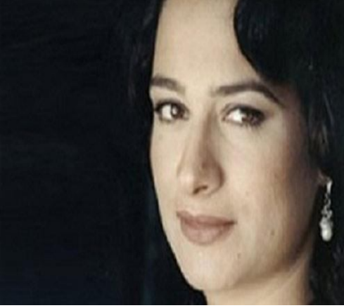
مركز دمشق الافتراضي للدراسات والرأي Althawra editorial

فيما لسان المزايده السياسيه لا يكف عن ترديد المؤامره الكونيه و القاء اللوم على الغرب- الولايات المتحده-اسرائيل الامبرياليه. و نسيان الاعاقه الذهنيه التي يترجمها الحكام في المنطقه منذ اقدم العصور -جوارى- و نزعات حيوانيه - قمع و أفرع امنيه . و رجال اشباه متقفون مأجورون . انانيه تكاد تمسك بتلابيب الرجال. انانيه تسحق الانثى على صخره الرجوله. لكن للتمييز :