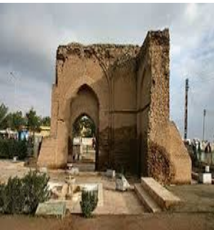
ابو القاسم -الرقية

كما قام اللواء ٩٣ باحراق مساحات واسعة جداً من محصول الشعير بشكل متعمد وخصوصاً قرية صيدا والأراضي المجاورة للواء كما قام بقصف الأقطان بعين عيسى وقصف قرية علي الجهيل بصواريخ مالوتكا من اللواء ٩٣ وقامت باحراق المحاصيل الزراعية يوم السبت: