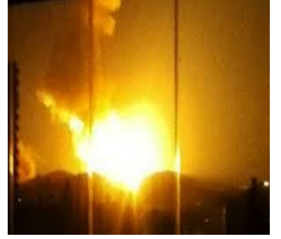
مركز دمشق الافتراضي للدراسات والرأي Althawra editorial

تأتي في سلسلة ضمن سلسلة مستمره لمنع حزب الله من الاستحواذ على اسلحه قد تعزز قدرات الحزب عسكرياً سلسلة سابقة و لاحقه اخذت اسرائيل على عاتقها تنفيذها . العملية احدثت خسائر فادحة للنظام . العملية عبرت عن قوتها السنه اللهب الضخمه . العملية تشكل صفعه قويه في وجه ايران التي لطالما اعلنت ان اي اعتداء على الاسد اعتداء عليها . ايران لا تحرك ساكناً ظاهر . ايران تعلم الكلفه العاليه جداً سياسياً بالدرجه الاولى و عسكرياً في حال زجت بنفسها بشكل صريح و علني في مواجهه مباشره مع اسرائيل . اللهم عبر حزب الله المتورط بشكل اعمى في الجحيم الذي يحرق الاسد منكبداً بشكل يومي خسائر في الارواح قبل العتاد