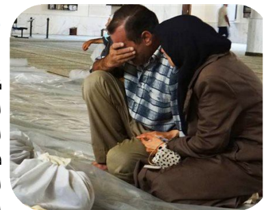
مركز دمشق الافتراضي للمعلومات والراي:

الى متى يبقى الابرياء يدفعون ثمن الاجندات الاقليميه التي لا تحمل الا الظلام و الرجعيه و التخلف و الجهل للمنطقه واولها اجندات ايران التي كفت عن ان تكون الجار الودود للمنطقه تداعيات ما حصل تحمل الكثير من التوجس و الريبه حول مشروع يهدف الى حرق المنطقه طائفياً لانقاذ ما يمكن انقاذه