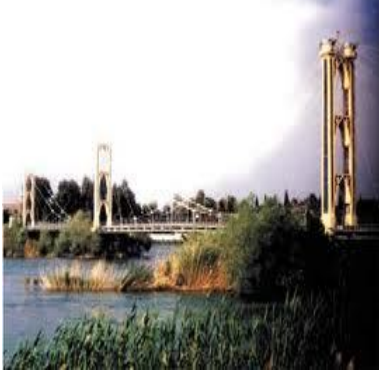
إياد الحمّادة - دير الزور