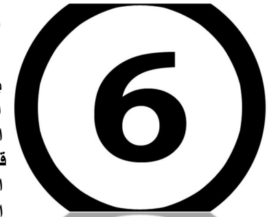
مركز دمشق الافتراضي للمعلومات والرأي:

بعد تدخل حزب الله في سوريا و الزج بثقله بشكل غير محسوب و اتباعاً لاملاءات طهران تدخلت قوى اقليميه لتدلو بدلوها في الشأن السوري احتساباً للمصالح الاقليميه و درعاً للمخاطر الاثنيه من المخالب الايرانيه الممسكه بتلابيب المنطقه ذلك ان ايران لم تترك مجالاً للتوجس و الشك الا و توغلت فيه تصريحات و افعال و شبكات تجسس و اسلحه نوويه في الطريق ربما علماً ان