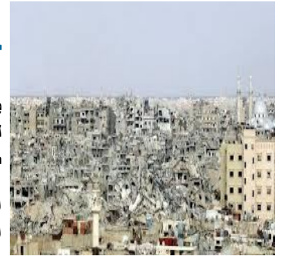
مركز دمشق الافتراضي للمعلومات والرأي: