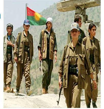
مركز دمشق الافتراضي للمعلومات والرأي: