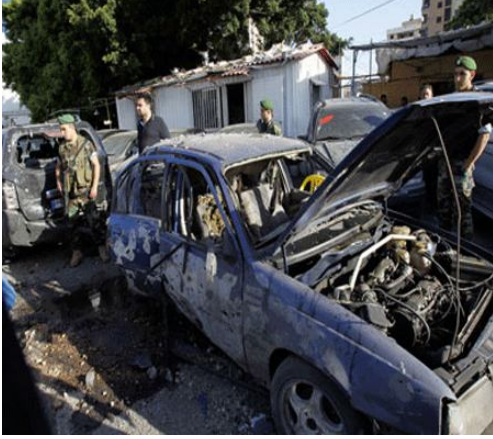
مركز دمشق الافتراضي للدراسات والرأي Althawra editorial

سقط صاروخان في الضاحية الجنوبية المعقل السكاني لحزب الله .