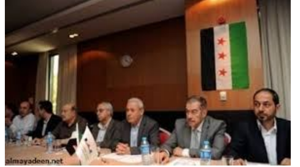
مركز دمشق الافتراضي للدراسات والرأي Althwra editorial

و تجاه موسكو خليجياً على الاقل لرغبه موسكو بمزيد من التعاون الاقتصادي.