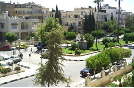
مؤيد زريق - ادلب