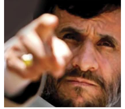
مركز دمشق الافتراضي للدراسات والرأي Althawra editorial