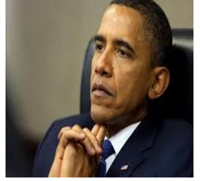
مركز دمشق الافتراضي للدراسات والرأي Althwra editorial

و ليس ضرورياً التذكير بأن بدايه ولايته الاولى تعرض لمحاولة اغتيال على الاقل لمره واحده من قبل خليه سريه بيضاء. و ان الاقليات-العرب-المسلمين-الافارقة- اللاتين-كانوا جل من انتخب-باراك اوباما. صحيح ان العقده المذكوره ضمنيه و نفسه بالدرجه الاولى و ليست ظاهره. غير ان السيد باراك اوباما ترجم عقدهه وفق للاتي: