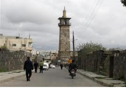
رغد ابو حوران - درعا

قرفا: قامت عصابات الاسد باقتحام بلدة قرفا ونفذوا عمليات حرق ونهب وتكسير للمنازل وحملة دهم واعتقالات مع انقطاع تام للاتصالات الارضية والخلوية والانترنت