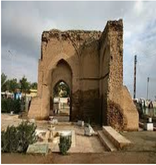
ابو القاسم -الرققة