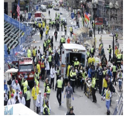
مركز دمشق الافتراضي للدراسات والرأي Althwra editorial

و الاوعيه كانت مليئه بمسحوق اسود اللون و مسامير عاديه حال انفجار الوعاء و اصطدامها بالجسم تحدث خروقات للجسم و اتلاف في الانسجه.