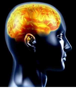
بيسان السوري -دمشق