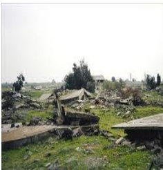
جبران الجولاني - القتيطرة

الناصرية: تشهد القرية قصف شبه يومي. قرقس: قصف يومي ومركز على أطراف البلدة الشرقية والشمالية من اللواء ٩٠ والسرية المتواجدة على أطراف قرية الكوم