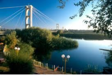
وسام السعيد-دير الزور

بالنسبة لمجريات الأحداث في محافظة دير الزور، شهد هذا الأسبوع تطورات من الناحيتين المدنية والعسكرية.