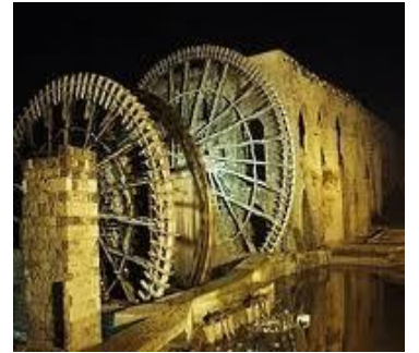
ام رعد -حملة

الجيش السوري الحر تحرير حاجز تل عثمان في ريف حماة الغربي للمرة الرابعة على التوالي وتدميره بشكل كامل تمكن أبطال الجيش الحر من تدمير حاجزين في ريف حماة الشرقي في معركة الجسد الواحد واغتنام عدد من الدبابات والآليات العسكرية