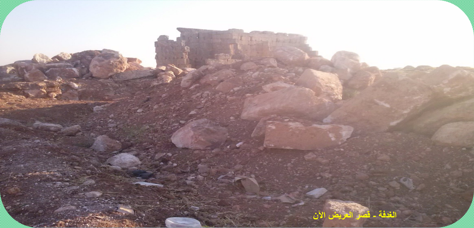
الغدفة - قصر العريض الآن