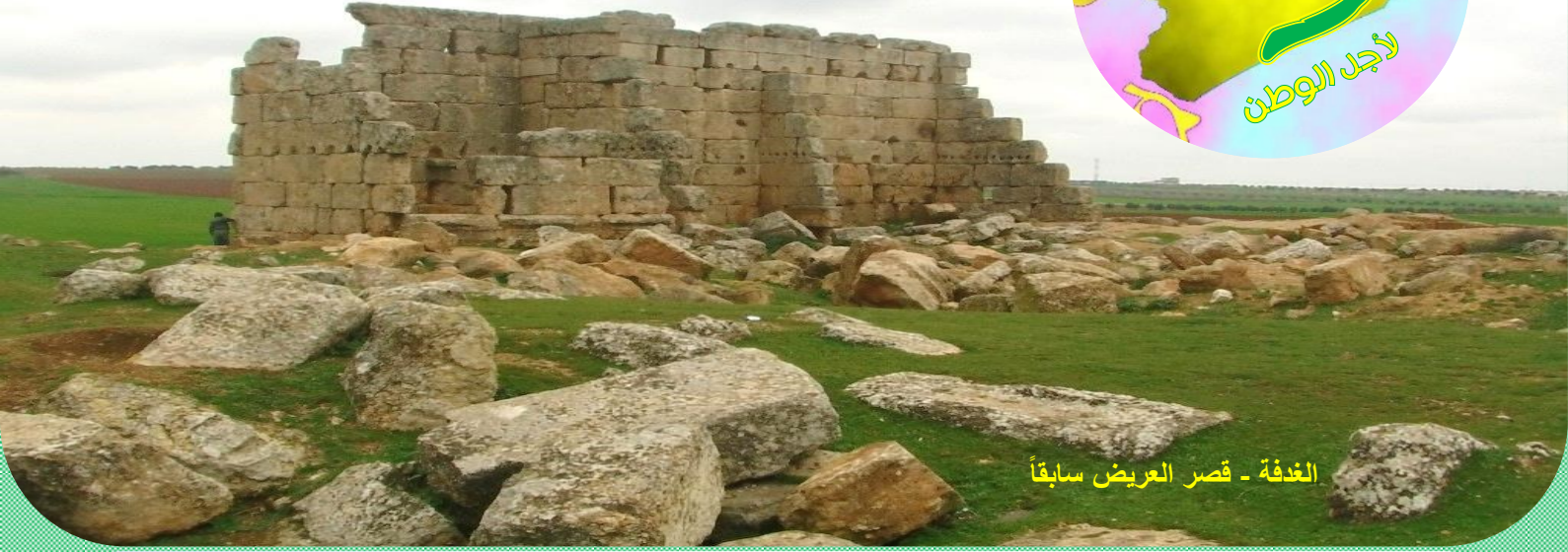
الغدفة - قصر العريض سابقاً