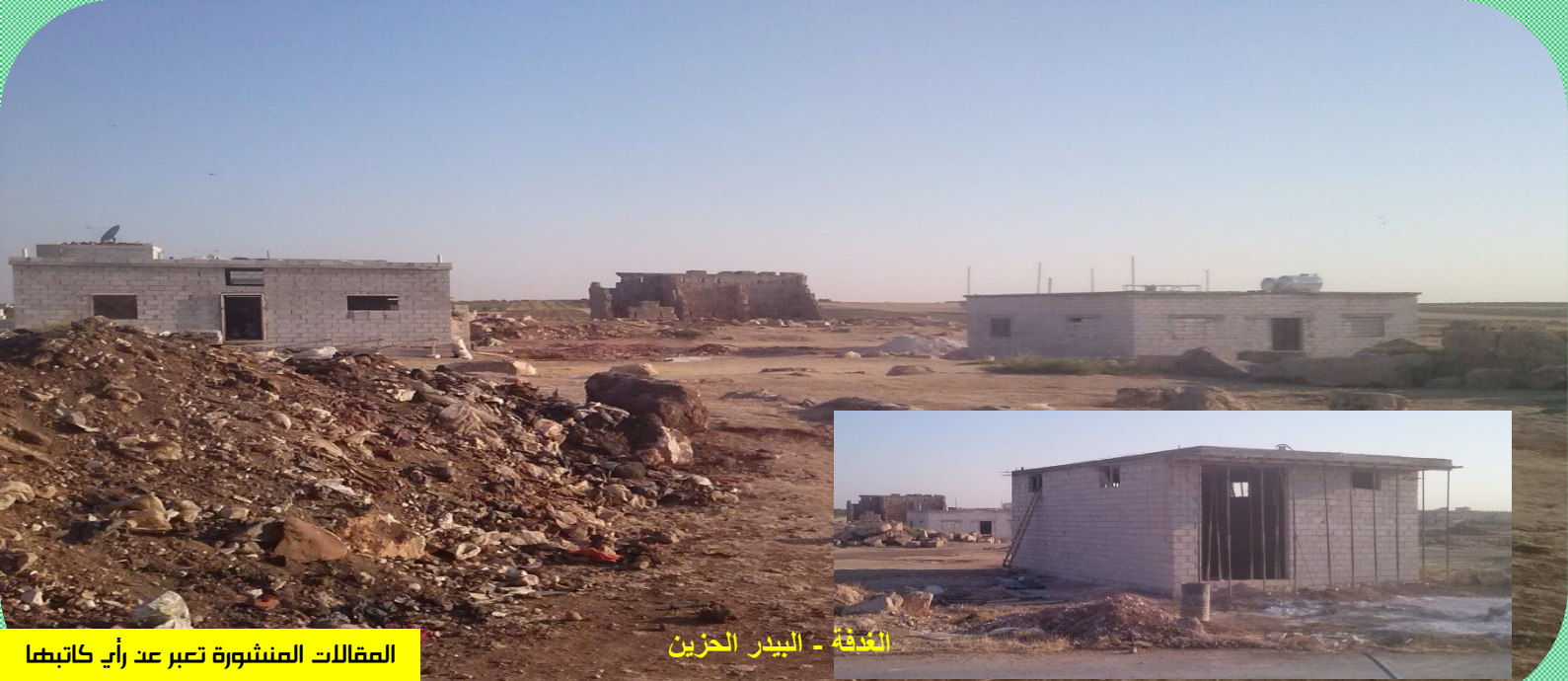
الغدفة - البيدر الحزين