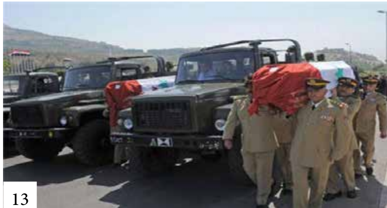
الكرد من منظور المعارضة السورية