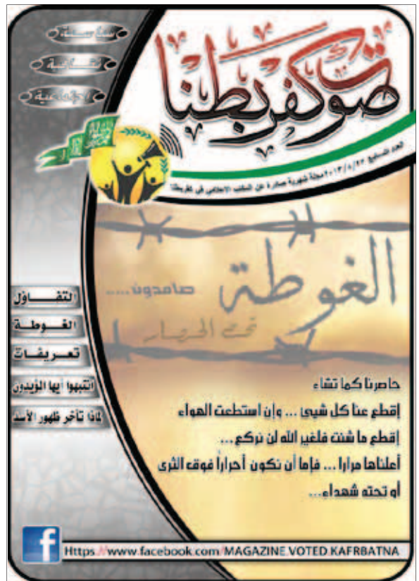
صوت كفر بطنا - العدد السابع 2013-8-23