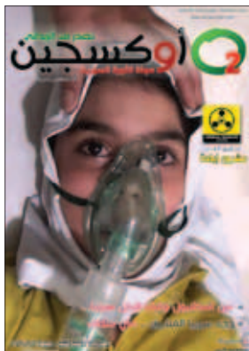
أوكسجين - العدد الثاني والسبعون 2013-8-23