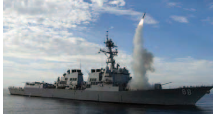
ست مدمرات أمريكية شرق المتوسط مجهزة بصواريخ كروز

لقوات الأسد لنقل مقراتها وامتصاص الضربة بعد تفريق القوات على عموم سوريا، ما يقلل من خسائره المحتملة. وبدأ النظام فعلاً بنقل مقراته الأمنية والاستخباراتية إلى مباني المدارس والجامعات والمناطق السكنية في دمشق، كما قام بنقل عشرات الصواريخ من نوع سكود وراجمات الصواريخ من قواعد عسكرية شمال دمشق، إذ وثق ناشطون أكثر من 15 مدرسة في أحياء دمشق تحولت مؤخرًا إلى ثكنات عسكرية.