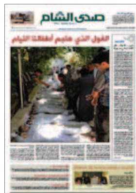
صدى الشام - العدد الخامس 2013-8-26