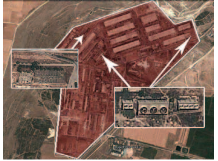
يعتبر معمل الدفاع 790 من أهم الثكنات العسكرية شمال حلب