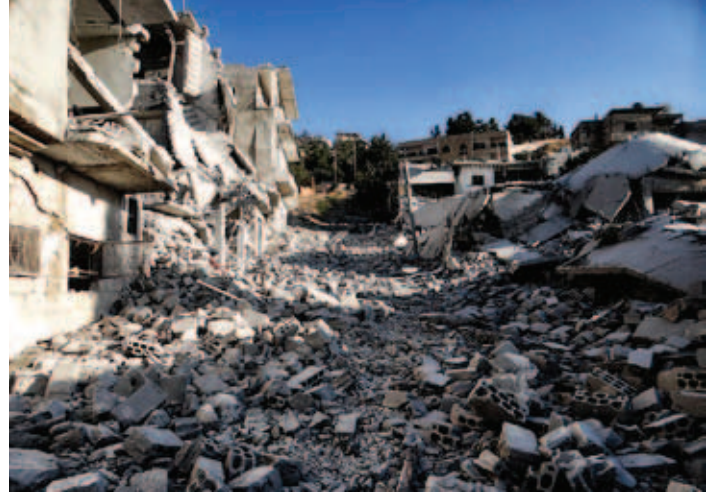
أبنية تمدرت بالكامل جراء القصف بالبراميل على أريحا

فيما ردت قوات الأسد بقصف عنيف بالبراميل المتفجرة أسفر عن أكثر من 60 شهيداً.