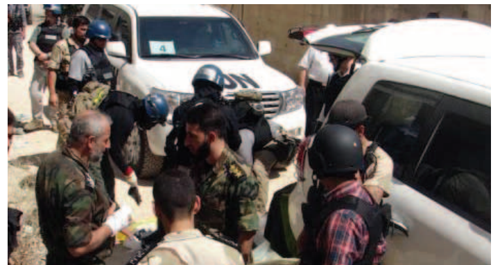
محققو الأمم المتحدة أثناء زيارتهم مواقع في الغوطة

أعلن أن النتائج النهائية لتحليل العينات قد لا تكون جاهزة قبل أسبوعين، وذكر دبلوماسيون أن بان كي مون أبلغ مندوبي الأعضاء الدائمين في الأمم المتحدة بهذا الأمر خلال اجتماع لمجلس الأمن في نيويورك يوم الجمعة، في حين سيبلغ أعضاء الفريق الأمين العام تقريرًا شفويًا بالزيارة.