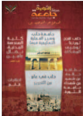
جامعة الثورة - العدد الثامن عشر 2013-8-23