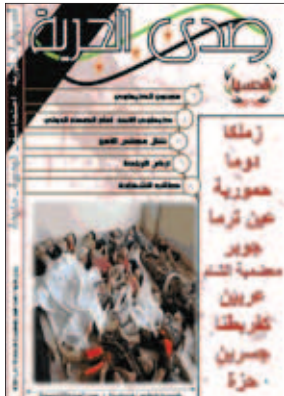
صدى الحرية - العدد الرابع والعشرون 2013-8-23