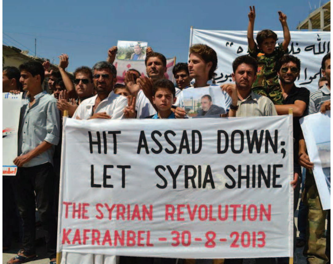
لافتة في مظاهرات جمعة «وما النصر إلا من عند الله» كتب عليها: اضرِبوا الأسد ودعوا سوريا تشرق من جديد - كفرنبل 30 آب 2013