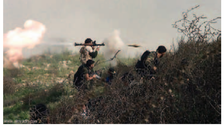
الجيش الحر يرتب أوراقه للإفادة من ضربات محتلمة