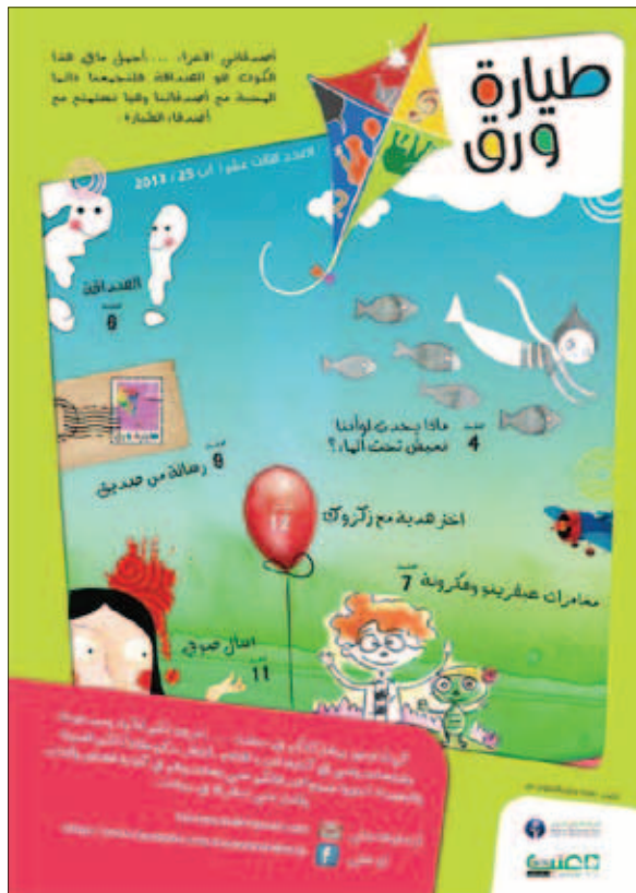
طيارة ورق - العدد الثالث عشر 2013-8-25