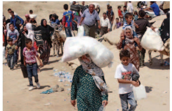
حدود كردستان العراق مع سوريا تشهد حركة نزوح كبيرة

التي سمحت بدخول اللاجئين الكوردي السوريين، ارتفاع أعداد الداخلين إلى الاقليم منذ 15 آب المنصرم إلى أكثر من 50 ألف لاجئ.