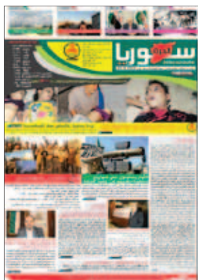
سوريا الحرة - العدد الثالث عشر 2013-8-26