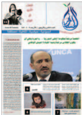
المسار الحر - العدد الثامن والأربعون 2013-8-21