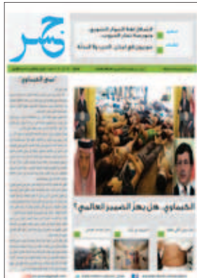
جسر - العدد الـ 27 والرابع والثلاثون 2013-8-27