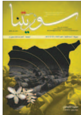
سوريتنا - العدد الحادي بعد المائة 2013-8-25