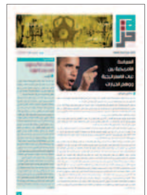
حرية - العدد الواحد والخمسون 2013-8-26