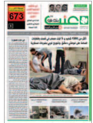
عنب بلدي - العدد التاسع والسبعون 2013-8-25