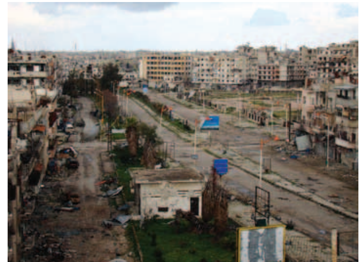
الجيش الحر يعاني داخل الأحياء المحاصرة في حمص القديمة

معاندة الجيش الحر في حمص المحاصرة تتزايد بسبب استمرار الحملة التي يشنها النظام عليها، بعد أن سيطر على حي الخالدية، مما أدى لزيادة كبيرة نسبياً في عدد شهداء وجرحى الجيش الحر، وتحديات خطيرة يواجهها مقاتلوه. لم يستطع عناصر الجيش الحر البقاء في