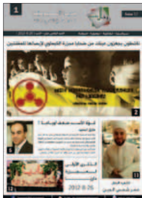
رجال العاصمة - العدد الخامس عشر 2013-8-25