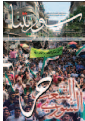
سوريّتنا- العدد الخامس والتسعون 2013-7-14