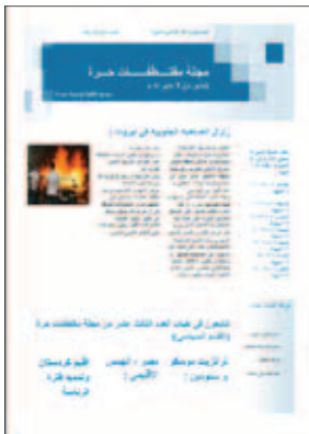
مقططات- العدد الثالث عشر 2013-7-10