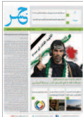
جسر- العدد السابع والعشرون 2013-7-9