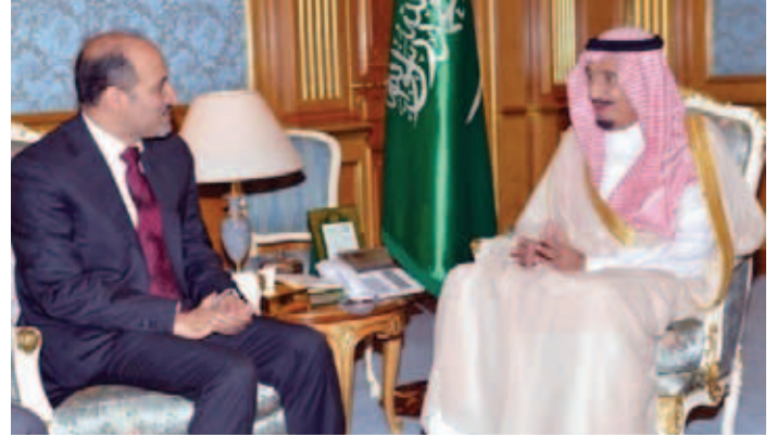
الجربا: أجنحة جنيف 2 ليست بكتاب منزل من السماء

صندوق خليجي لدعم المعارضة بـ 400 مليون دولار