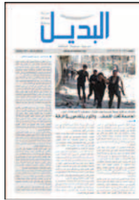
البديل- العدد السابع والتسعون 2013-7-14