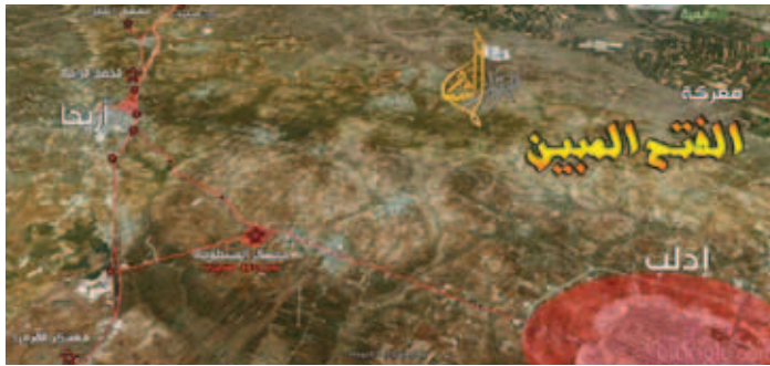
تتركز عملية «قطع الوريد عن القرميد» حول معمل القرميد الذي حوله النظام إلى ثكنة عسكرية

تردد مهما كانت عاقبة أجوبتي، لكن والحمد لله كانوا أغبي من أن يستفيدوا من حالتي المتردية التي وصلت إليها. في نهاية اليوم الثالث تم نقلنا إلى هنكار الطائرة الذي تم إغلاقه كلياً وفتح باب صغير في طرفه ليصبح معتقلاً كبيراً، كنا وقتها حوالي 350 معتقلاً في هذا الهنكار الذي تختلف أساليب التعذيب الجماعي فيه، كان هناك ازدحام شديد وحرارة مرتفعة وفدارة لا توصف ورائحة كريهة لا تحتمل لدرجة تجعل الشبيحة يدخلون عدة أمتار فقط وعلى أنوفهم كامات، كان نصيبنا من الماء 3 تنكات فقط يتم ملؤها مرتين في اليوم ولكل معتقل تقريباً نصف كأس من الماء كان الطعام مرتين في اليوم مرة عند الظهر ويكون نصيب كل معتقل ربع رغيف من الخبز وزيتونة، ومرة عند المغرب وكان يتم إطعامنا أرز أو برغل وفي أغلب الحالات كان الطعام مالحاً لتعطيشنا أكثر،