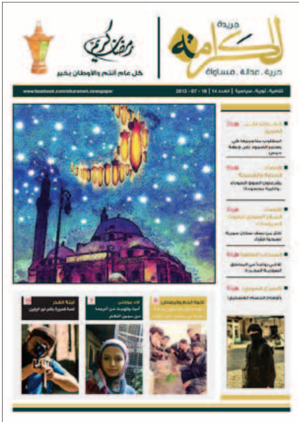
الكرامة- العدد الرابع عشر 2013-7-10