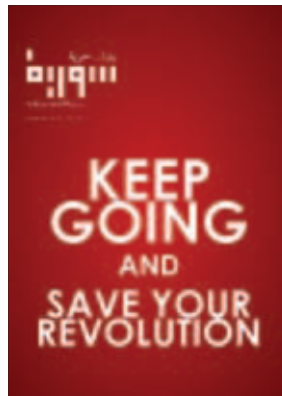
سورية بدأ حرية- العدد السادس والخمسون 2013-7-12