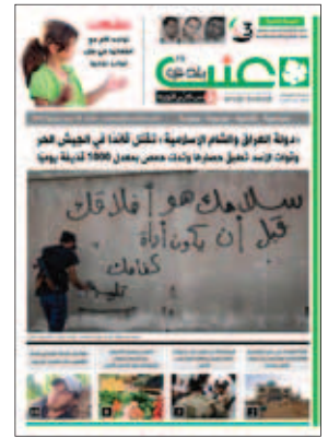
غيب بلدي- العدد الثالث والسبعون 2013-7-14