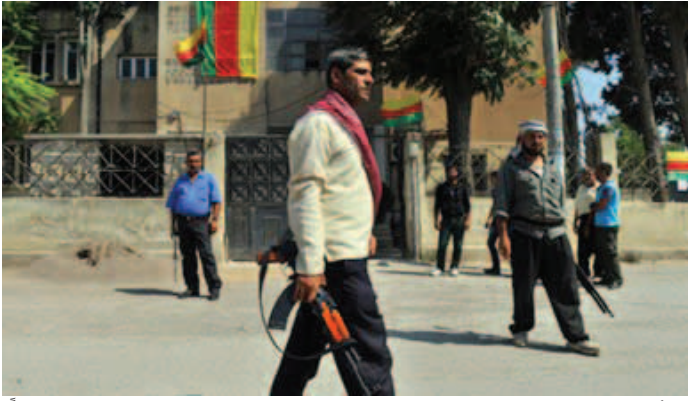
أسفرت الاشتباكات بين المقاتلين الأكراد وجبهة النصرة ودولة العراق والشام عن سقوط 29 قتيلًا