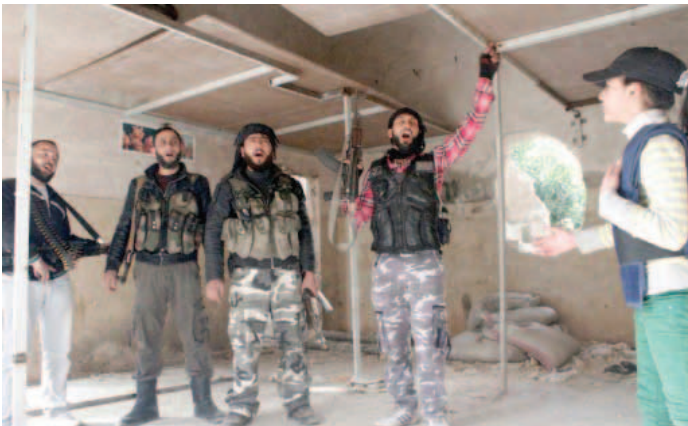
تمكن مقاتلو الحر في حلب من إسقاط طائرة حربية للنظام فوق خان العسل

كما تشكل هذه التطورات مصدر قلق لتركيا، خوفاً من تشجيع المجموعات الكردية الانفصالية على أراضيها. ولفت الوزير التركي إلى أن «النظام قد يلعب بالأكراد والعرب والتركمانيين، ضد