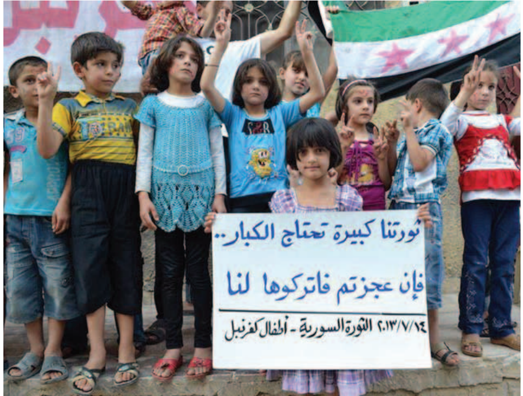
ثورتنا كبيرة، تحتاج للكبار.. فإن عجزتم، فاتركوها لنا - كفرنبيل 14 تموز 2013

قرار تعديل مجلس النقد والتسليف، هل ينقذ الليرة السورية من الانهيار؟!