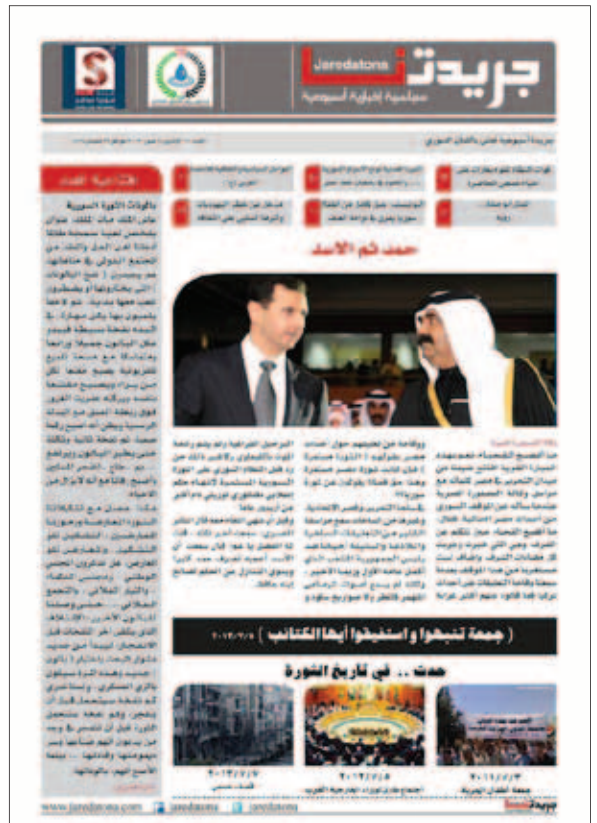
جريدتنا- العدد السادس عشر 2013-7-8