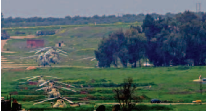
يعد مطار حماة العسكري ثالث أكبر المطارات العسكرية في سوريا