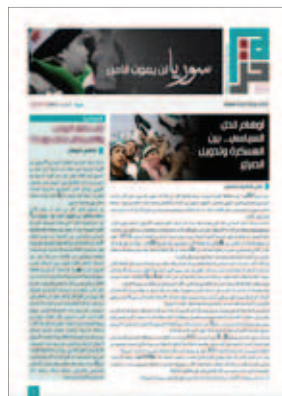
حمية - العدد الخامس والأربعون 2013-7-15