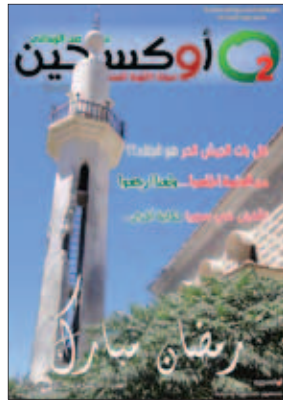
أوكسين- العدد السادس والستون 2013-7-14