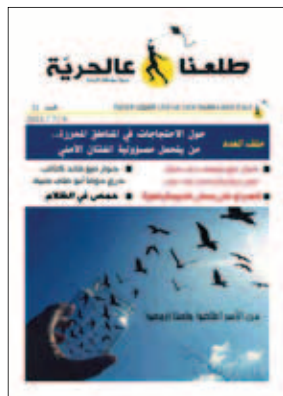
طلعتنا- العدد الواحد والثلاثون 2013-7-9