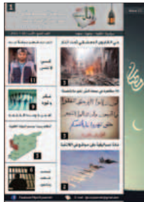
رجال العاصمة- العدد التاسع 2013-7-14