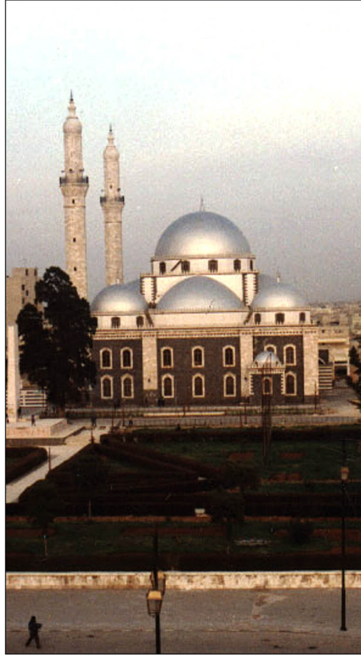
مسجد خالد بن الوليد - حمص

الحكم لا بد له من عصبية اما دينية واما قبلية ، فالخلافة الراشدة كانت العصبيتان في القمة تدين وقوة قريش ثم خفت الدينية وتعصبت القبلية ، أما اليوم فالحكام يحكمون بقوة القبيلة ومن يواليها في الجيش لذلك نستطيع أن نفهم سقوط مرسي .. و ذلك لضعف الدين في الشعب وقوة الشوكة في المخالفين من الجيش والمخابرات .