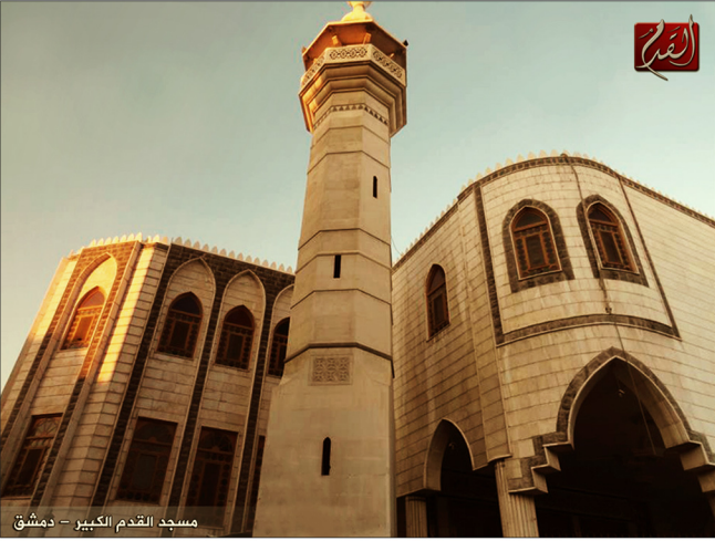
مسجد القدم الكبير - دمشق

لا بد من صنع الرجال ، ومثله صنع السلاح وصناعة الأبطال علم في التراث له اتضاح ولا يصنع الأبطال إلا في مساجدنا الفساح في روضة القرآن في ظل الأحاديث الصحاح في صحبة الأبرار ممن في رحاب الله ساح من يرشدون بحالهم قبل الأقاويل الفصاح