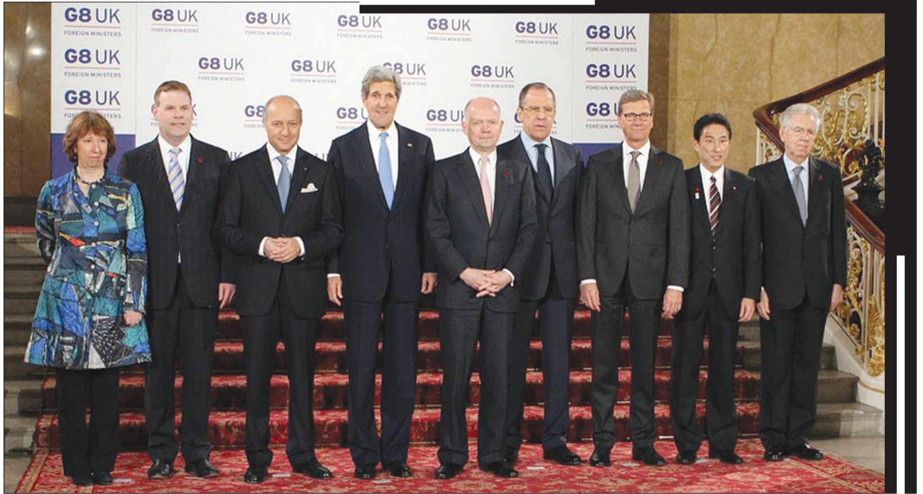
قادة قمة الثماني في صورة تذكارية في لندن ..... فمن يتذكر معاناة السوريين وآلامهم و أمالهم ؟

وفي بيانهم دعا وزراء الدول الثماني الي "زيادة المساعدة الانسانية وتحسين الوصول الآمن للوكالات الانسانية الي الشعب السوري بالتنسيق مع جميع اطراف الصراع". ولم تظهر نتائج ملموسة في لقاءات غير رسمية للوزراء مع اعضاء من المعارضة السورية على هامش الاجتماع الذي حضره وفد من الائتلاف الوطني السوري طلباً لمزيد من المساعدة الانسانية، لكن مسؤولين قالوا انهم لم يتلقوا أية وعود.