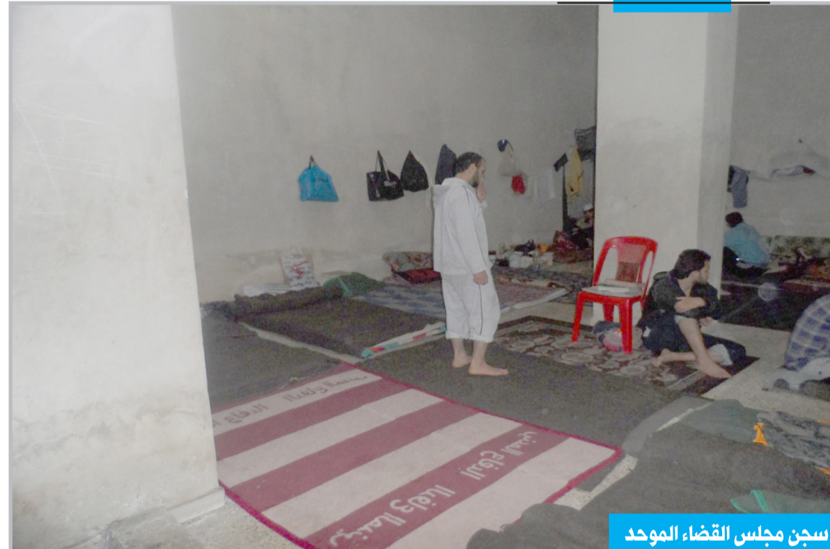
سجن مجلس القضاء الموحد

وعلى موضوع علامات التعذيب: «عندما تم إلقاء القبض عليه من شباب على الجبهة متحذراً مقاتلاً، وهم يقبضون على شخص تسبب في مقتل أمهاتهم وأبنائهم وأصدقائهم، قد لا يكون رد الفعل قاسياً جداً، وهذا ما حصل، ولكن عندما وصل إلى هنا لم يعد يتعرض للتعذيب، وهنا لا أقول أنه لا تحدث حالات تعذيب في سجون الجيش الحر، ولكن نحاول ضبطها بقدر ما نستطيع، نحن في صفوفنا لا نملك محققين خبراء، ولذلك نتيجة لبيئة مجتمعية فاسدة رسخها النظام فترة طويلة، قد تحدث تجاوزات يعاقب عليها المسي، أما الموقوف من قبلنا، سواء أكان شبيحاً أم تم إيقافه بجرم آخر، فيتم تحويله إلى الهيئة الشرعية التي تنتظر بأمره».