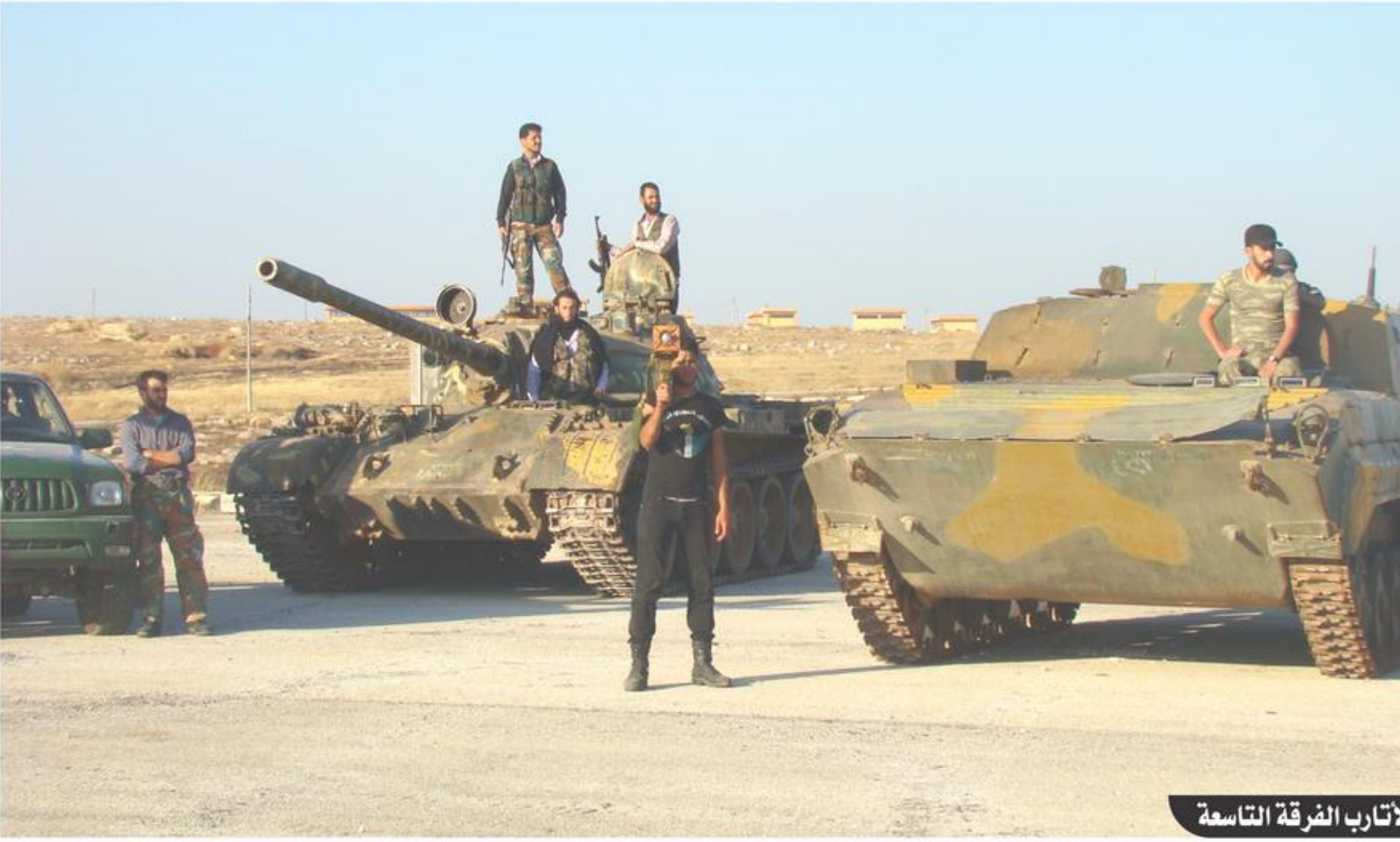
الأتارب الفرقة التاسعة