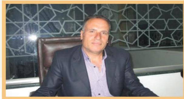
المجلس المحلي لمحافظة حلب Local Council of Aleppo Province