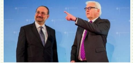
أحمد طعمة مع وزير خارجية ألمانيا لقاء الزيارة التي تمت فيها عائلته للجوء

أول أعمال رئيس الحكومة المؤقتة أحمد طعمة.. تأمين لجوء عائلته