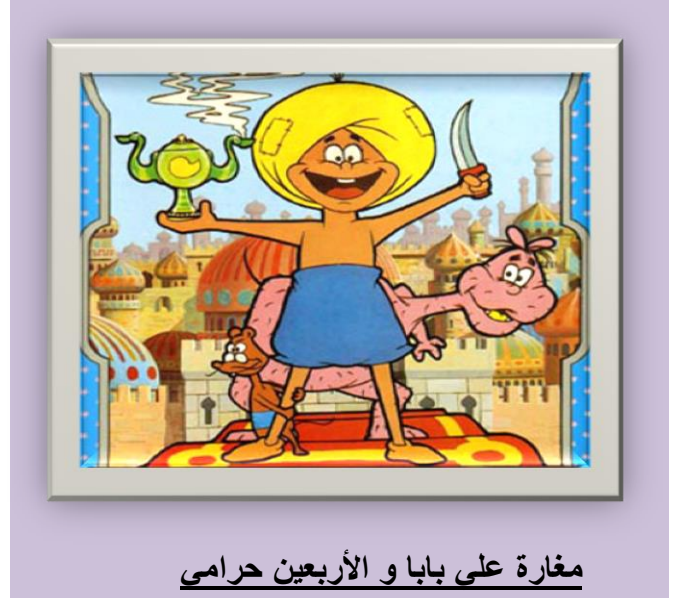
مغارة علي بابا و الأربعة حرامي