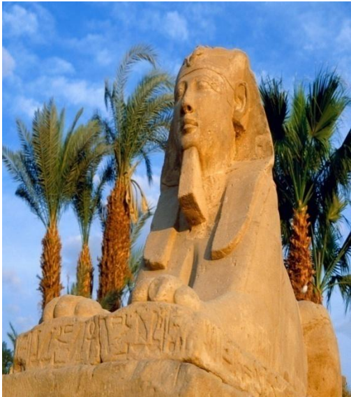
جمع واعداد ماجد رسلان الامين