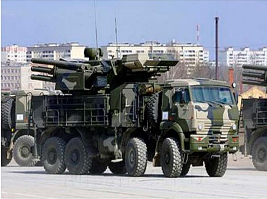
تعتبر روسيا نظام الأسد الشريك الاستراتيجي الرئيسي لها في الشرق الأوسط والمصدر الرئيس لترسانته العسكرية