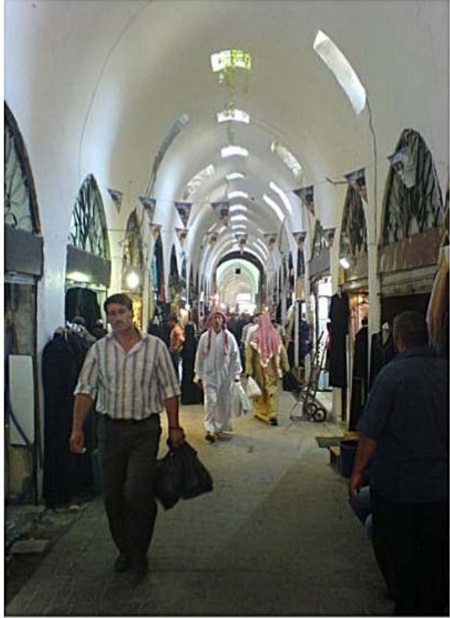
السوق التاريخي بحمص قبل تهديمه

قام خبراء آثار سوريين وأجانب بتوثيق بعض الانتهاكات وعمليات التخريب لتكوين وثيقة تؤسس لتقصي الحقائق في مجال الآثار بهدف تقديمها للهيئات العالمية، وتقول المعارضة السورية إن النظام السوري يدمر التراث الإنساني خلال عملياته العسكرية الحربية، من خلال قصفه لمساجد وكنائس وقلاع وحتى منازل تاريخية، هي جزء لا يتجزأ من تراث حضاري يمتد عمره أكثر من ستة آلاف سنة !