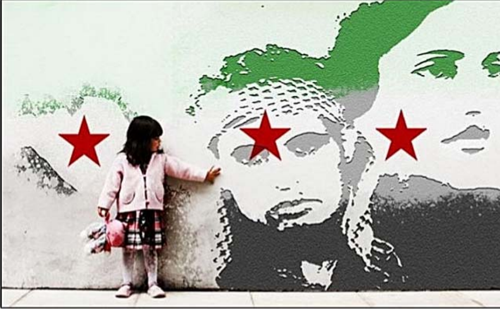
أدى فن التصميم الإعلاني والگرافيكي دوراً كبيراً في تنمية الوعي الثوري وتحريسه