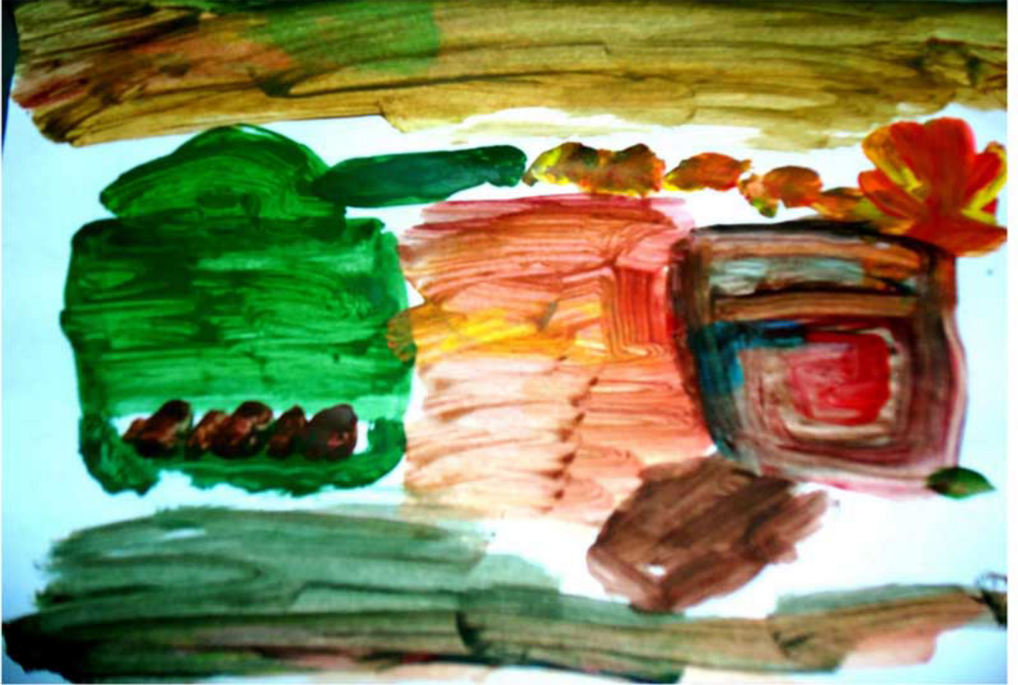
بريشة طفلة من حمص - 9 سنوات