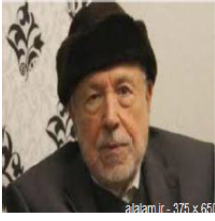
alabaa-376 x 661

- إرهاب النظام السوري وجرأته المروعة يراه العالم كله طائرات محوطة، وصواريخ مدمرة، وبراميل متفجرة في كل وقت وفي كل مدينة وقريّة، وضحايا يومية بالعشرات والمئات؛ ويسمعه في صرخات المعدبين في السجون والمعقلات، وتحسب اليتامى والأيتام والشاكلات في كل مكان ومع ذلك فهذا النظام الإرهابي الإجرامي الوقح يدعي دون حياء أنه يحارب الإرهاب! إذا لم تستح فاصنع ما شئت، صنع رسول الله.