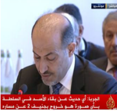
الجربا: أي حديث عن بقاء الأسد في السلطة بأي صورة هو خروج بجنيف 2 عن مساره