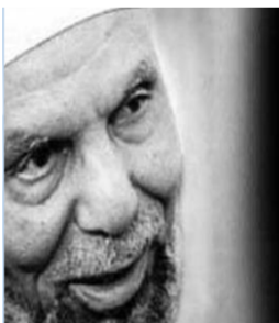
الشيخ / محمد منطولي الشعراوي

و في فترة عيد الاضحى المبارك قامت عطاء الخيرية - باتبو و بدعم من جمعية المغتربين الحلبية و الشيخ