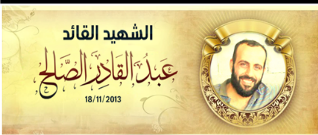
الشهيد القائد عبد القادر الصالح 18/11/2013

– مسؤول بجهة النصره بالقلمون .. إذا اضطرننا سندخل لبنان لمحاربة حزب اللات. – تدفق المقاتلين العراقيين الشيعة إلى سوريا بعد زيادة المنحة إلى ٢٥٠٠ دولار. – خسائر الميزانية للنظام السوري بسبب الأحداث التي تشهدها البلاد نحو ( ١٠٠ مليار دولار ) حتى الوقت الحالي. – النظام يعد لهويات مؤتمنة تعينه على تشييع سوريا واعتقال النازحين. – مروحيات النظام ترمي إمدادات عبر المظلات للمحاصرين في السجن المركزي بحلب. – كادر مشفى رأس الحصن يقدم استقالته من جمعية صندوق إعانة المرضى الكويتي إلى حين إجراء تحقيق نزيه في فساد ادارة الجمعية في الريحانية. – رئيس حزب الاتحاد الديمقراطي "PYD" صالح مسلم يعلن سعيه لإقامة إقليم كردي مستقل مقسم إلى ثلاث محافظات هي عفرين وعين العرب وقامشلي في إطار فدرالية سورية. – مجموعة من الهيئات الطبية تعلن تشكيل مديرية للصحة لتوفير خدمات طبية متكاملة في القطاع الصحي في مناطق الثوار. – وجه أمين عام الجبهة الإسلامية رسائل إلى المجاهدين ضد نظام بشار وحلفائه موضحاً أن مشروع الجبهة "كان حلماً قبل سنة، وصار الآن حقيقة".