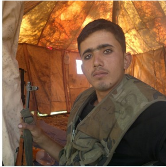
الشهيد البطل أحمد عواد الملقب "بالجولاني"