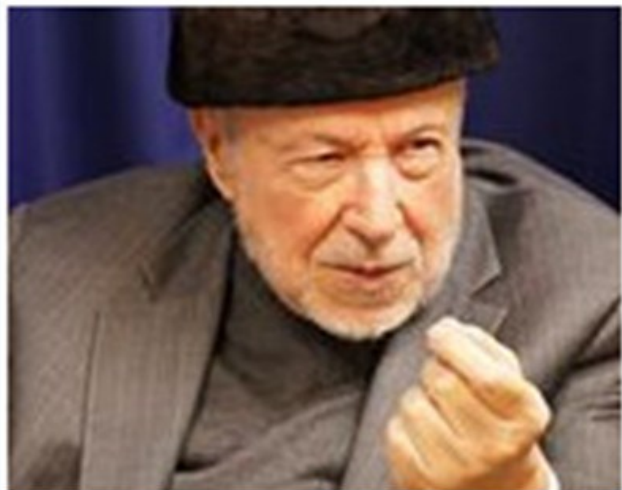
من قصيدة "رحيل" لعصام العطار