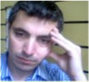
بقلم : إياد نجار

لقد كانت التحركات الأمريكية تجاه النظام السوري ظاهرياً تنصب في اتجاه واحد وهو عدم التزام النظام السوري بالتحذيرات الأمريكية وخطوطها الحمراء واستخدامه الكيماوي عدة مرات آخرها وأخطرها في الغوطة الشرقية هذا يعني أن الهدف ليس إيقاف الموت والمعاناة عن الشعب السوري وإنما التأكيد على الدور