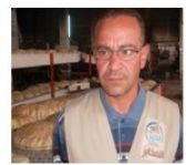
بدأت عمليات القصف بشكل

مركز عليه من الفوج (٤٦) وبشكل شبه يومي، مما خلق حالة من الخوف والرعب في نفوس العاملين فيه، ولكن العصابة المجرمة لم تكثف بذلك، بل عمدت إلى قصف المخبز بالطيران الحربي مما أدى إلى استشهاد (٦) عمال و(١٠) مدنين، و(١٨) جريح تحول اثنان